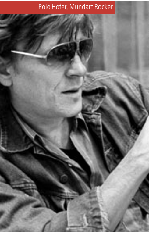
Polo Hofer, Mundart Rocker

«Musik ist gesund und macht Spass. Sie wird von Musikern, von Urhebern ausgedacht. Das ist mit Arbeit verbunden – und Arbeit muss entlohnt werden. Das Urheberrecht trägt dazu bei, dass ich von meiner Kunst leben kann. Internet-Piraterie, kostenloses Kopieren von Musik und Filmen nagen an der Substanz und Kreativität der Künstler. Daher muss das Urheberrecht den sich ständig verändernden Technologien angepasst werden.»